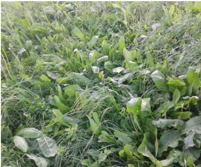
Abbildung 1: Eine Nährwertanalyse von selbst angebautem Futter kann dazu beitragen, dessen Verwendung in der Geflügelfütterung zu optimieren.