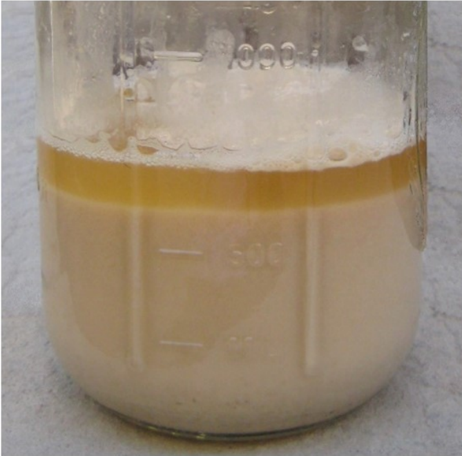
Abbildung 1: Hefe. V. Rodríguez-Estévez, Universität von Cordoba