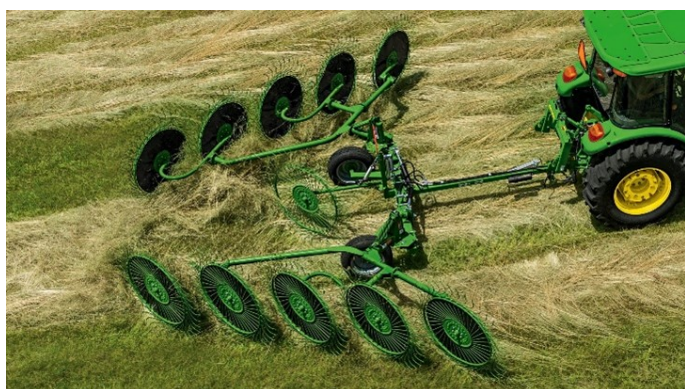
Figura 1: Remar el heno con una henificadora.