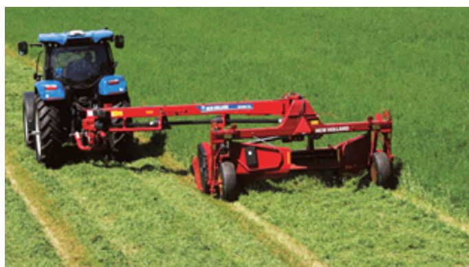
Figura 2: Corte de forraje.