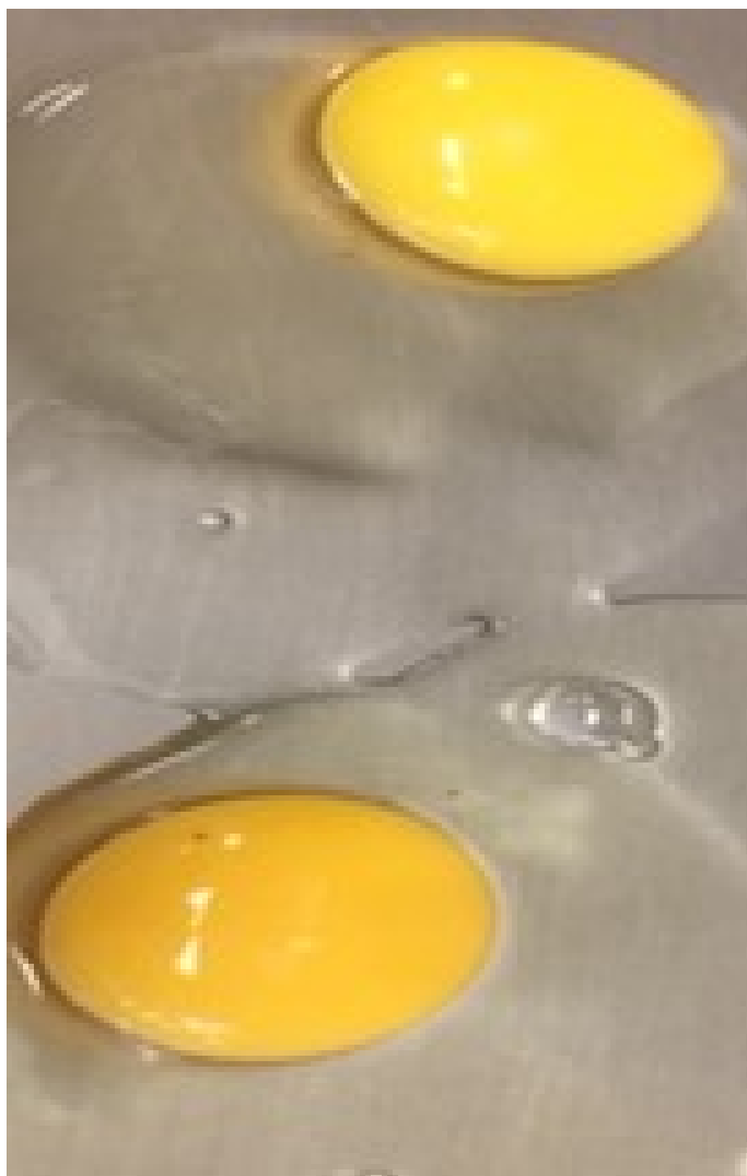
Figura 1: Diferencias en el color de la yema del huevo.