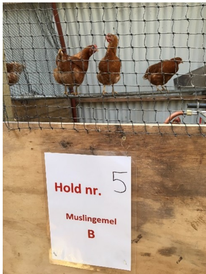
Figura 2: Alimentación de gallinas ponedoras con harina de mejillón.