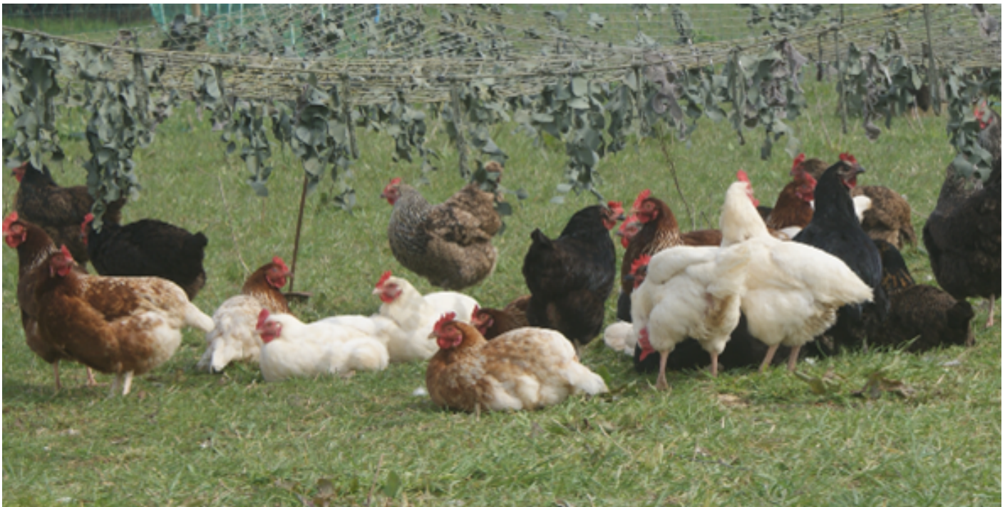
Figura 1. El forraje puede ser un alimento importante para los pollos ecológicos

La clave está en la gestión de los pastos y en los forrajes alternativos, como las pacas de heno, que serán necesarios durante el invierno o los periodos de sequía. Las fuentes de alta proteína, como la alfalfa y los tréboles, también pueden aportar parte de la proteína necesaria. También se pueden tener en cuenta los insectos e invertebrados que se comen en el prado, que pueden aportar parte de las proteínas y aminoácidos necesarios.