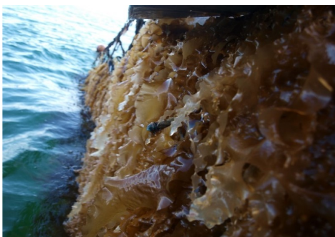
Figura 1: Alga parda, alga azucarera.