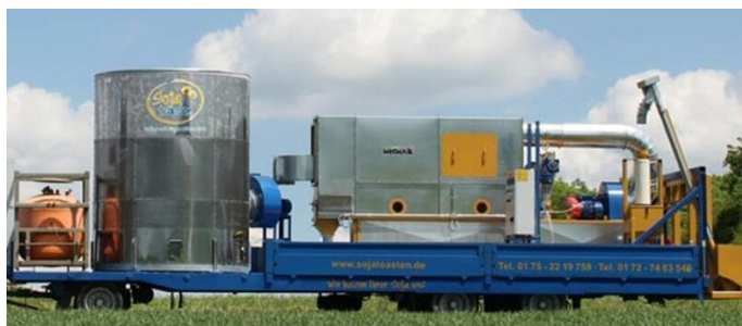
Figura 1: Tostadora móvil - Möhler Technik.