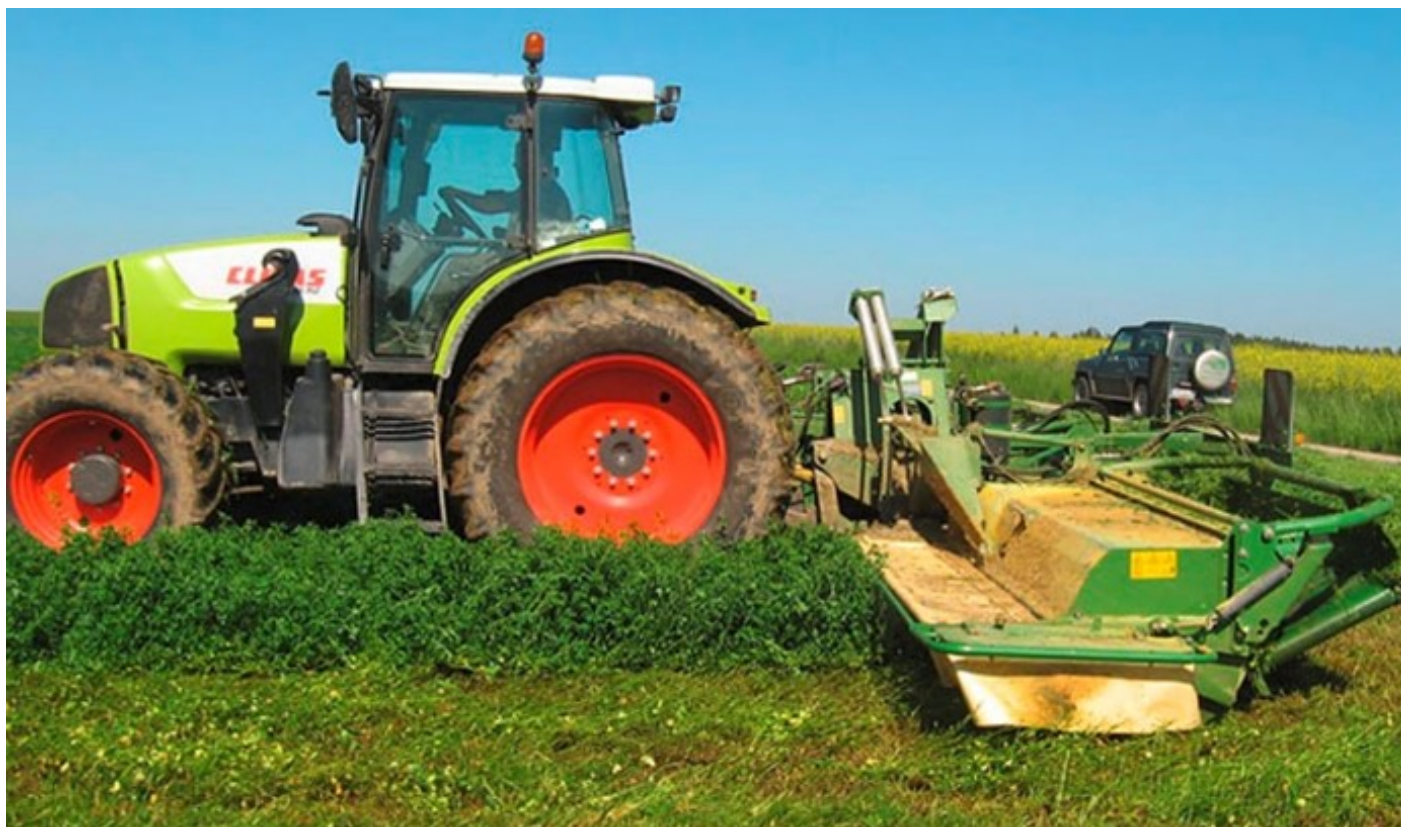
Figura 1: Segado de leguminosas de grano fino.