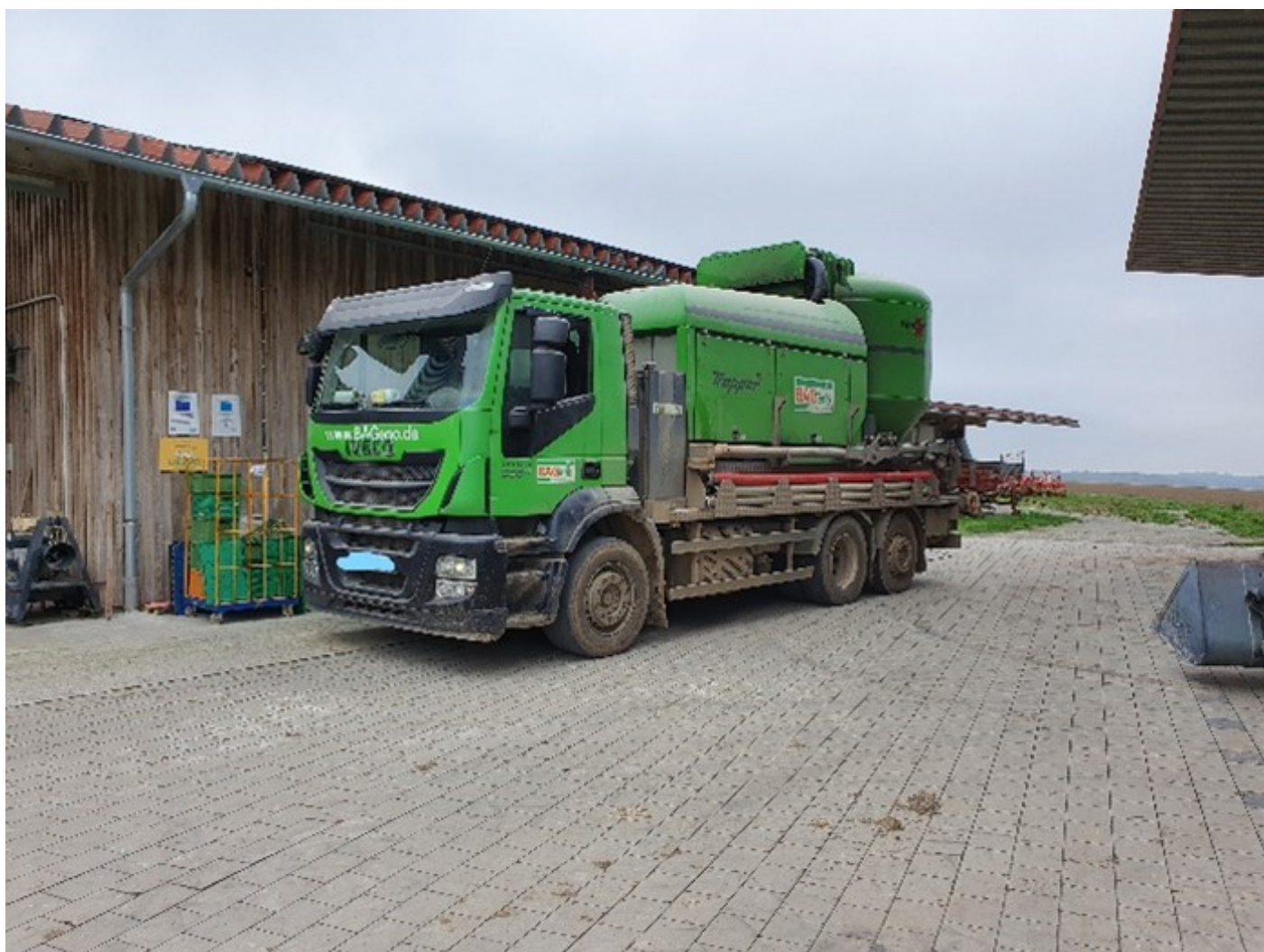
Figura 5: Planta móvil de molienda y mezcla.