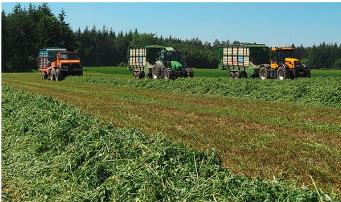
Figura 2: Las legumbres de grano fino se traen húmedas.