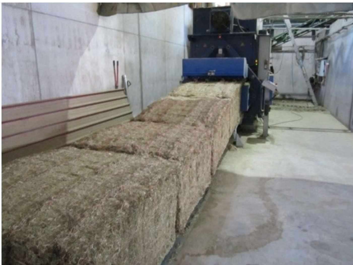
Figura 4: La cosecha se comprime en balas.