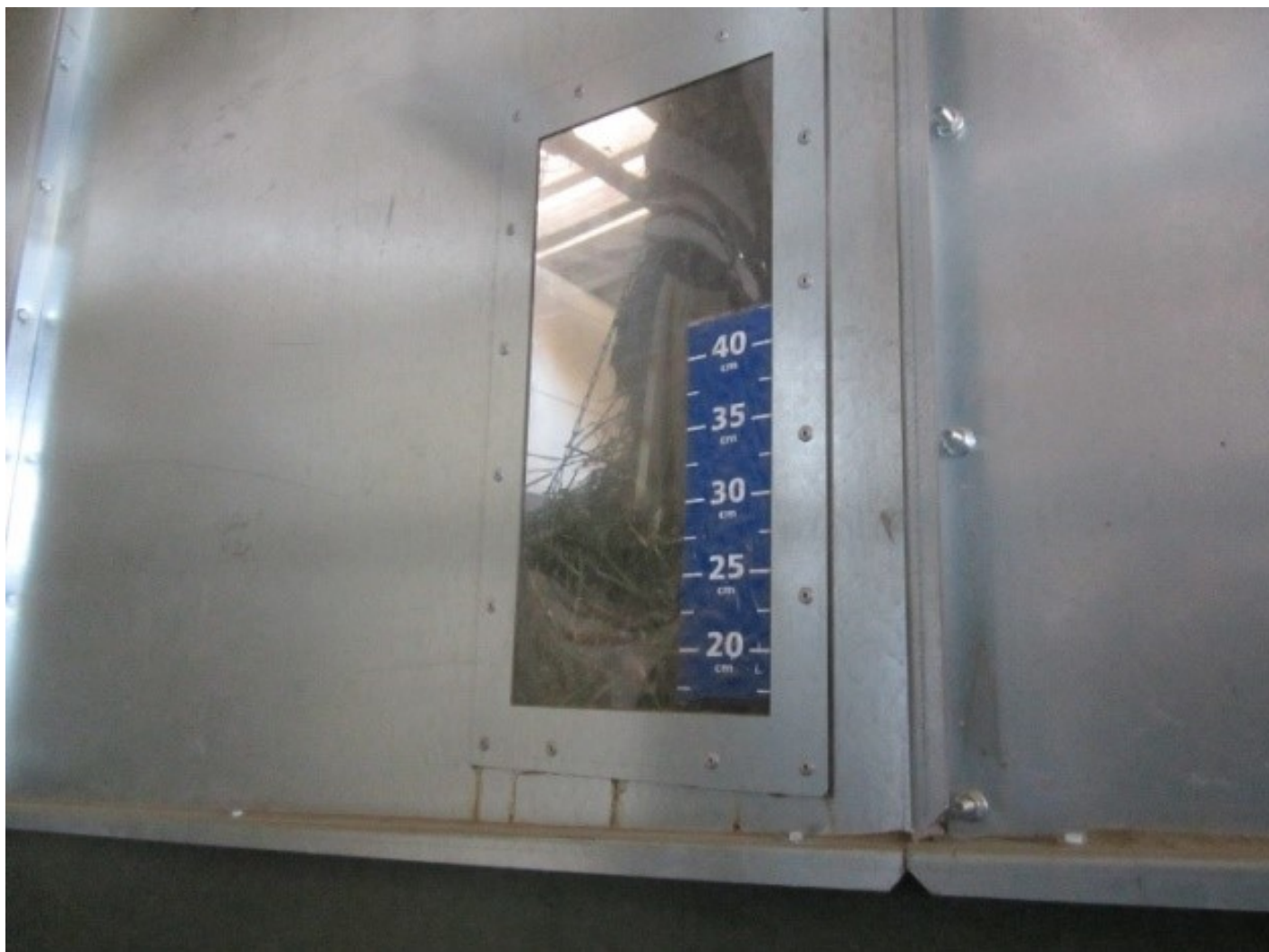
Figura 3: Contenedores de secado especiales con suelos perforados