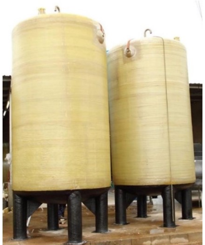
Joonis 2: Mahutid p rmi jaoks. V. Rodr guez-Est vez, Cordoba  likool