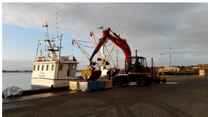
Figure 2 : Bateau spécialisé dans la pêche aux étoiles de mer.