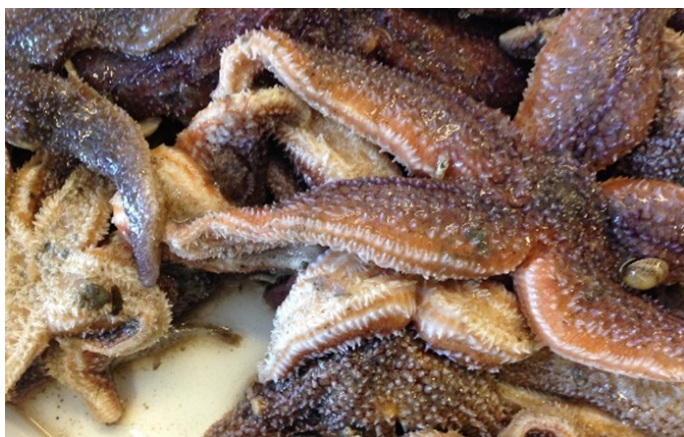
Figure 1 : étoile de mer avant traitement.