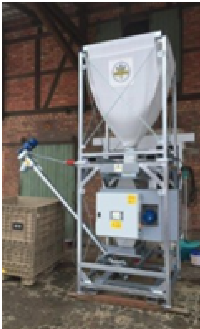
Figure 2 : Grille-pain mobile - Eco Toast EST GmbH.