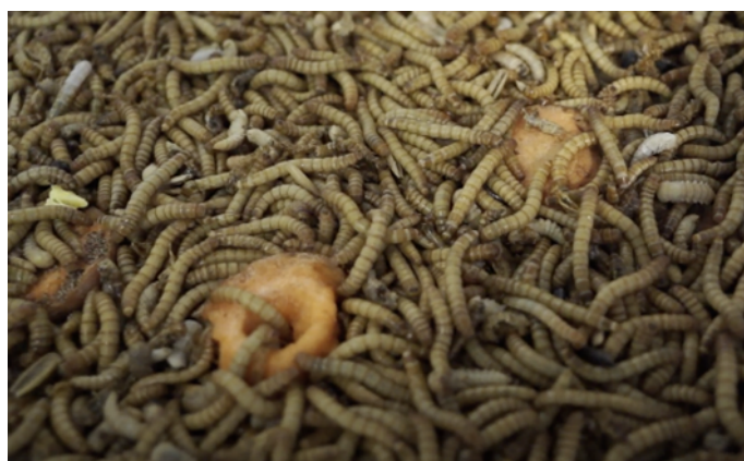
Figura 2. Vermì della farina.