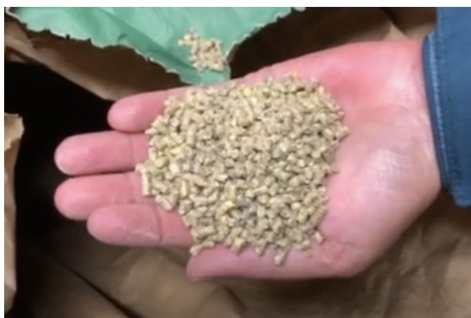
Figura 1. Farina larvale di insetti mescolata con mangime concentrato.