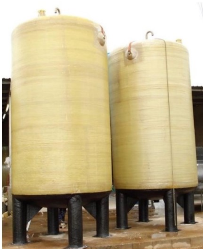
2. att ls: Rauga tvertnes. V. Rodr guez-Est vez, Kordovas Universit te