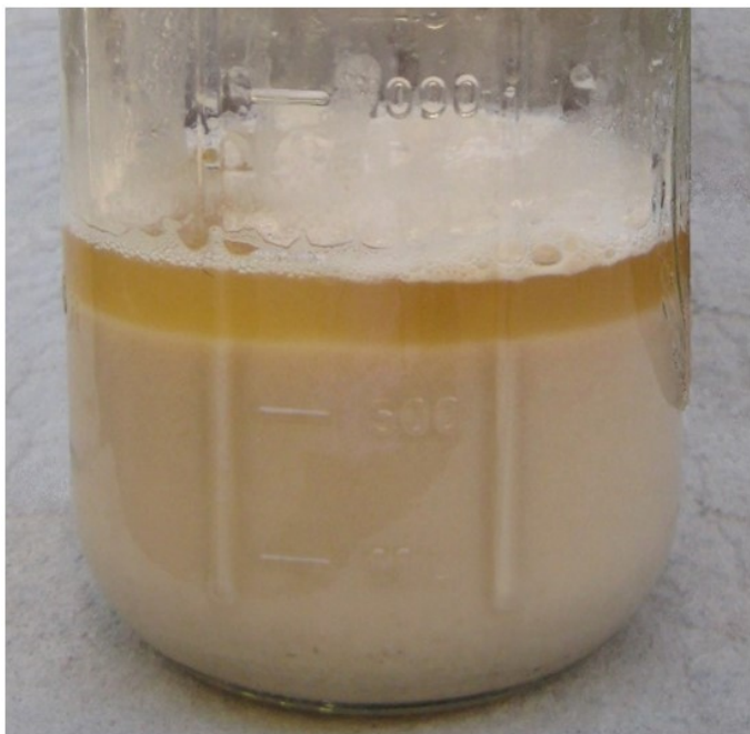
1. att ls: Raugs. V. Rodr guez-Est vez, Kordovas Universit te