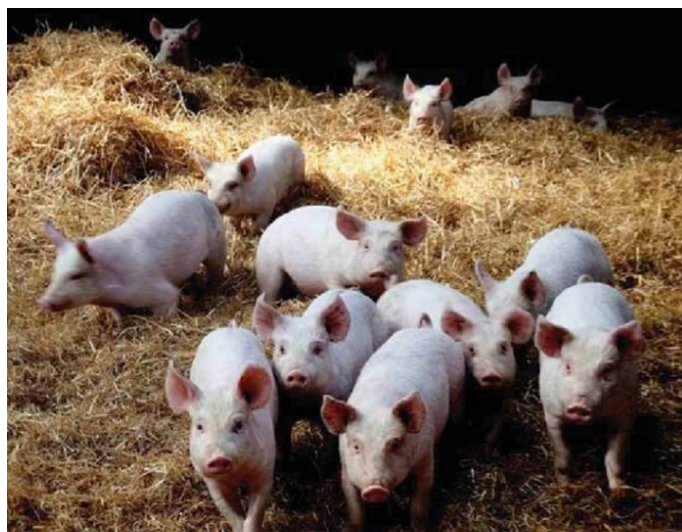
2. attēls: Bioloģiski audzēti sivēni var gūt labumu no jūras aļģēm.