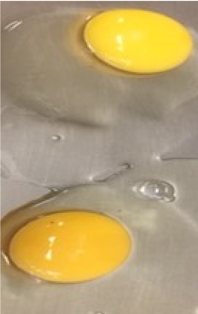
Figuur 1: Verschillen in de kleur van eigeel.