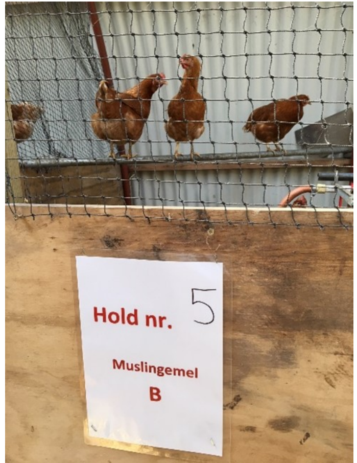
Figuur 2: Voeder met mosselmeel aan legkippen.